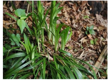
ツルニチニチソウ