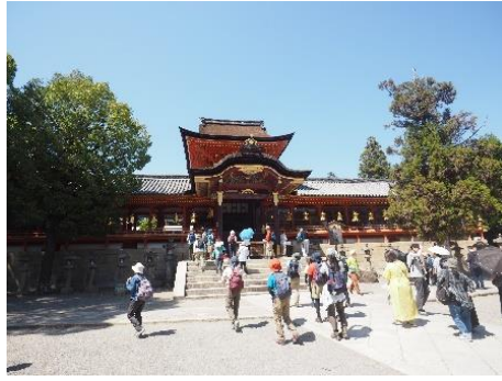
⑨石清水八幡宮本殿