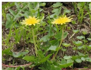
カンサイタンポポ