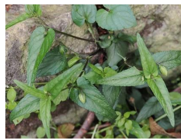
ナガバタチツボスミレ