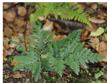
左、コヒロハハナヤスリ 中、クルマシダ 右、フユノハナワラビ