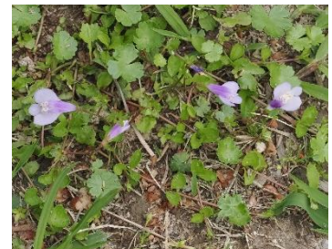
ムラサキサギゴケ