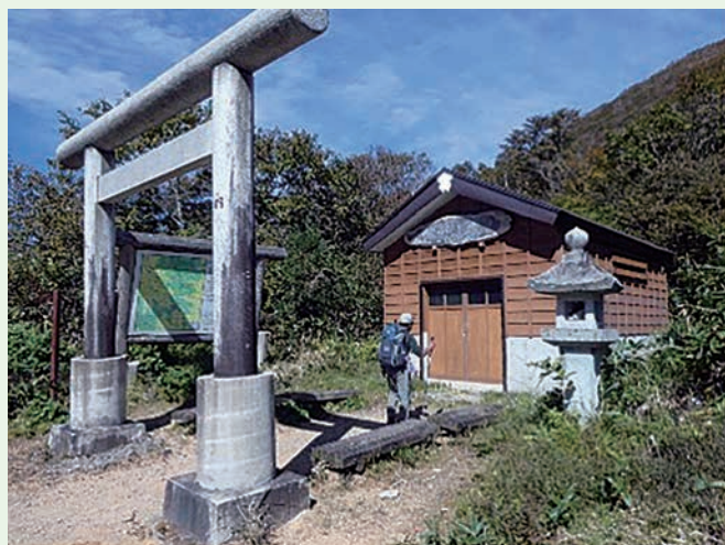
弥彦、赤城、諏訪の三明神を合祀したと伝えられる三国峠御坂三社神社 三明神の御利益が期待できるかも…