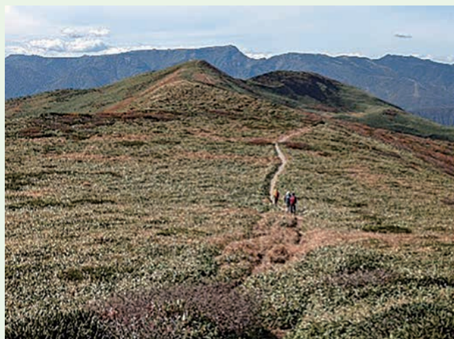
草原を思わせる稜線の平標山(背後は苗場山)

申込期間は令和6年6月3日(月)～7月24日(水)となっております。各都道府県ごとにとりまとめて申込をいただく形になりますので、各都道府県山岳連盟(協会)にお問い合わせください。