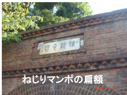
ねじりマンポの扁額