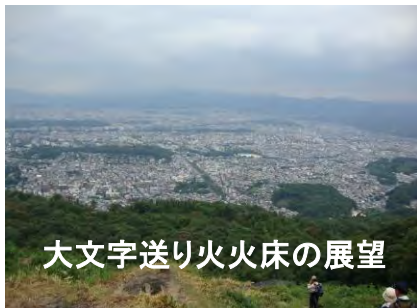
大文字送り火火床の展望