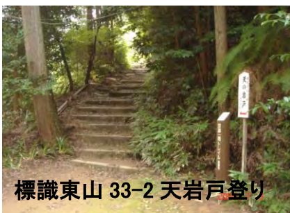
標識東山 33-2 天岩戸登り

安養寺のすぐ横に入口のある市営大日墓地の、奥まった一角に田辺朔朗博士と夫人の墓がある。