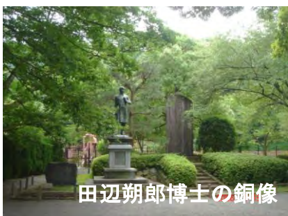
田辺朔郎博士の銅像