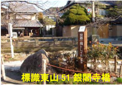
標識東山 51 銀閣寺橋