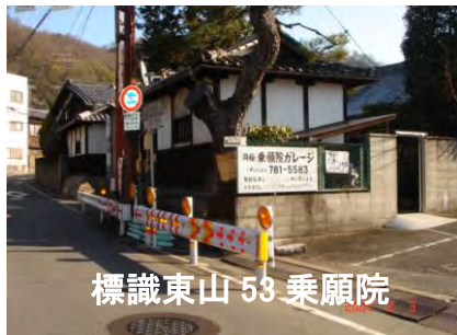
標識東山 53 乗願院

思想家であり宗教家「許されるならば、生きる」社会奉仕に生きかたを見い出す、崇高な西田天香師の一燈園の発祥地で、山科に移転する前の大正から昭和初期にかけて、今のノートルダム女学院敷地に道場があった。