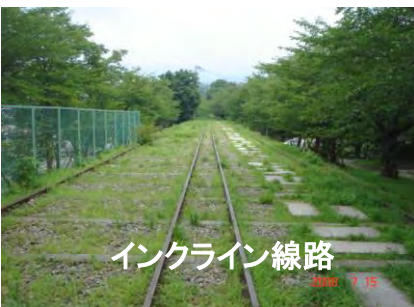
インクライン線路