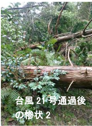
台風 21 号通過後の惨状 2