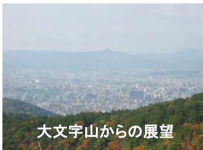
大文字山からの展望