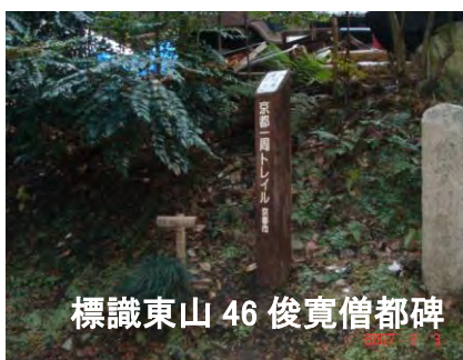
標識東山 46 俊寛僧都碑