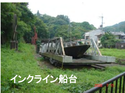
インクライン船台

トレイルコースは国道1号線沿いの標識東山30-2から「ねじりマンポ」を通り抜け、標識東山31から右へインクラインの石垣に沿って坂道を登る。