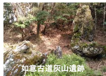
如意古道灰山遺跡

小峠から分岐した道を 500m 程度東へ行き、雨社を左下に見て如意寺址分岐から左に登ると、道が突然広くなり、標識に注意し跡のある如意ヶ岳に至る。施設の手前の細道分岐を右下から回り込めば施設の正面門に回れる。舗装された施設進入路を行き、途中のガードレールの切れ目の分岐を降れば、灰山遺跡と長等山を経て大津の三井寺まで辿れる。途中の林道分岐には入らない事。