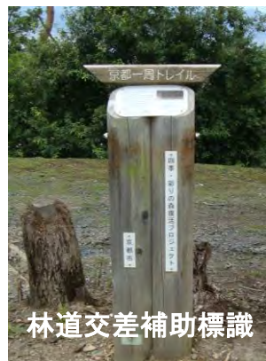
林道交差補助標識

若王子墓地前の西側広場が東山三十六峰「若王子山」で、その南の台地が東山三十六峰「南禅寺山」「独秀峰」ともいう。若王子墓地の手前の分岐を南側に降る道は、若王子墓地前からの道と合流し「駒が滝」から南禅寺奥の院を経て南禅寺へと降れる。南禅寺奥の院を直進し山道を登れば「七福思案処」に至る。