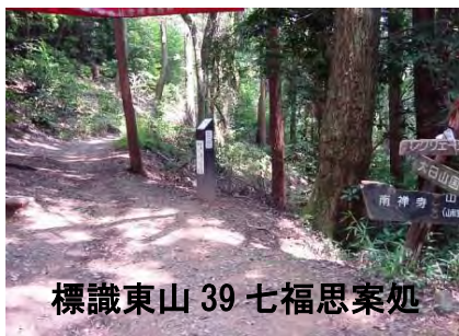
標識東山 39 七福思案処