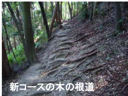
新コースの木の根道

「大日山」は東岩倉山とも称し、北岩倉山、南岩倉山、西岩倉山と共に、桓武天皇の勅願で都の鎮護として経を収めた岩倉があり、山頂に大日如来像が安置されていたというが、ここ東山三十六峰大日山には何の痕跡も残っていない。