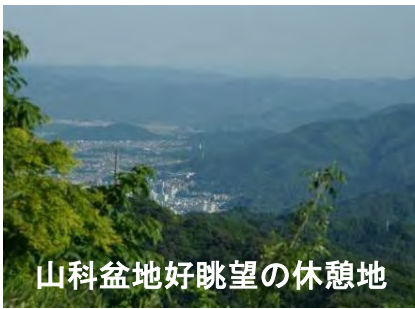
山科盆地好眺望の休憩地