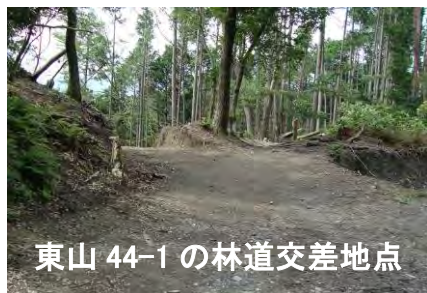
東山 44-1 の林道交差点

若王子神社は後白河法皇が遠く紀州熊野詣でをする代わりに勧請されたもので、創建には資材全て土石に到るまで熊野から運ばれたと伝え、那智の滝になぞらえた滝みである。三角池はこの滝の水源である。