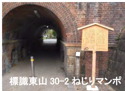
標識東山 30-2 ねじりマンポ