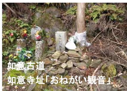
如意古道 如意寺址「おねがい観音」

林道が下りとなる小峠から左折すれば、鹿ヶ谷と三井寺を結び、往古から比叡山の南を通過する「白鳥越え」「山中越え」と共に、重要な幹線ルートとして使われてきた「如意越」の古道である。