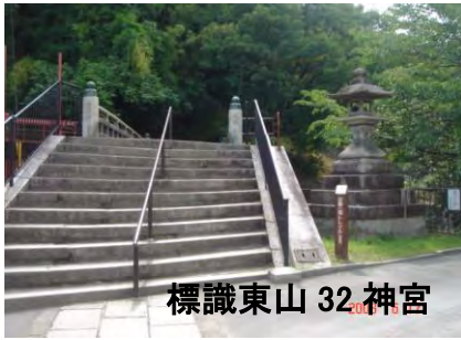
標識東山 32 神宮

『右奥の古びた建屋の大きな石造の仏像は、大日如来であるが「義経地蔵」という。源義経(当時は牛若丸)が奥州下向の折、馬上の武士が行き交いざまに義経に泥を蹴り上げ、怒った義経が切り殺したという。その武士の供養のために建てられたらしい。一説に蹴上の地名の由来とも言われている』