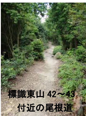
標識東山 42~43 付近の尾根道

この峰の南麓の谷間には、数十基ほどの古い墓石が散乱しており、大きな岩がいくつも崩れ落ちている。これは先年の阪神淡路大震災の余波ではないかと思われるが、墓地の上部には伝えによる行基座禪石らしきものも残っており、2mほどの供養塔も立っている。峰の西麓には大きな穴と、古い城址のようにも見える伽藍跡らしき平地が広がっており、ここが弘安・元弘の蒙古襲来の折には、亀山上皇も度々行幸をし、戦勝祈願をしたと伝える由緒ある観勝寺址ではないだろうか。