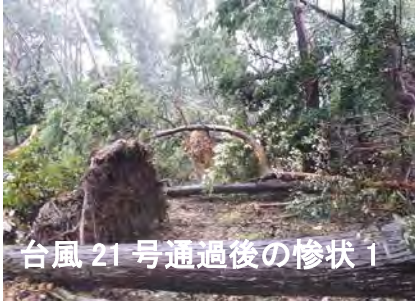
台風 21 号通過後の惨状 1