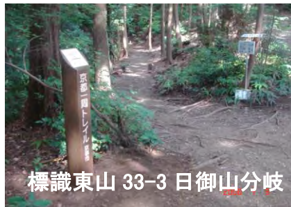
標識東山 33-3 日御山分岐

トレイルコースは神社の前、標識東山 33-1 を直進し古い石段を登る旧コースと、日向神社へ参道の石段を登り、境内を通り抜けて、急坂の無い安全な新コースに分かれる。