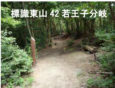
標識東山 42 若王子分岐